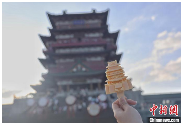
图为一位游客在滕王阁前展示滕王阁主题创意冰棒。刘力鑫 摄