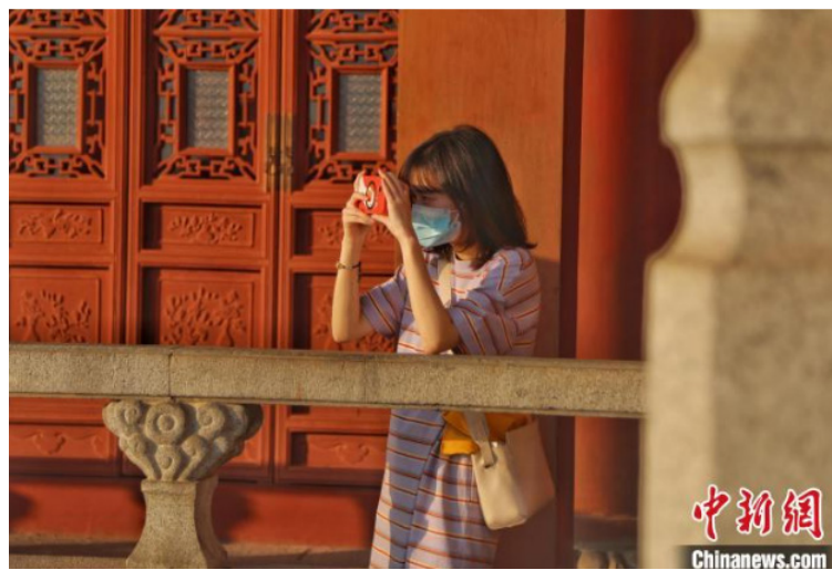
图为一位游客在滕王阁上拍照。