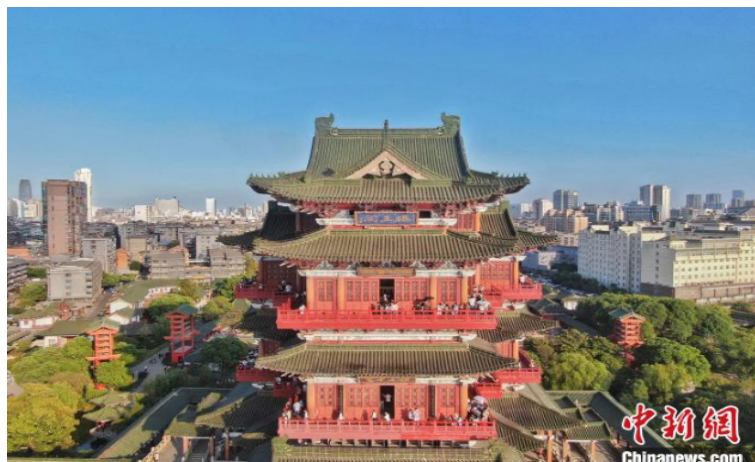
图为航拍不少旅客在滕王阁上观光游览。