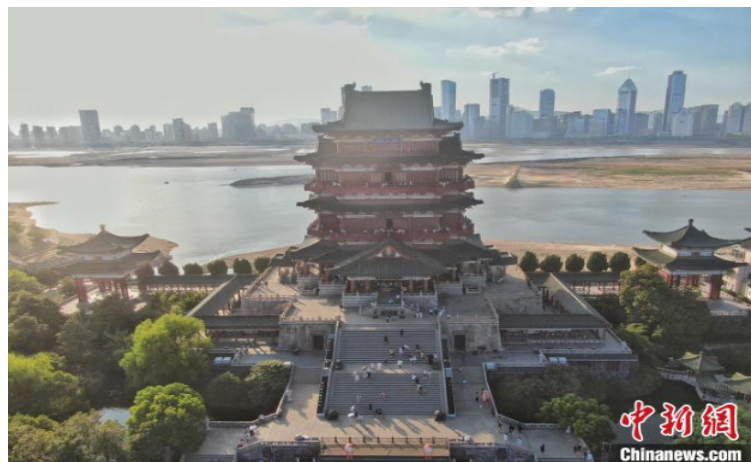
图为航拍不少旅客在滕王阁景区内观光游览。刘力鑫 摄