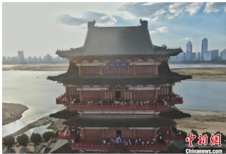
图为航拍不少旅客在滕王阁上观光游览。