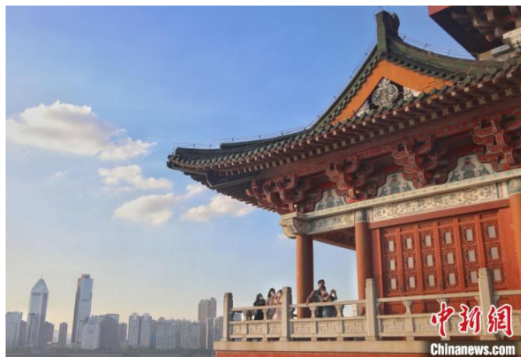
图为几位游客在滕王阁上观光游览。