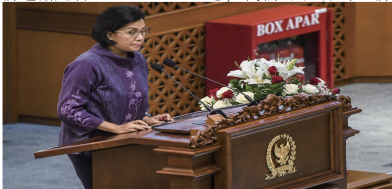
财政部长慕雅妮 (Sri Mulyani)

另一个迹象是全球采购经理人指数(PMI)的下降。2022年8月,世界制造业采购经理人指数从51.1降至50.3。这种下降表明全球经济逐渐走弱。