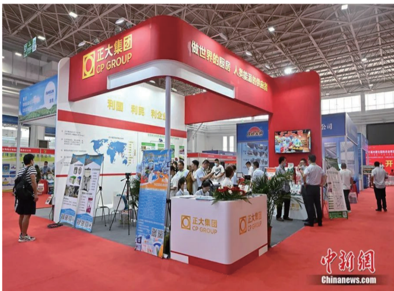
正大集团在内蒙古国际农业博览会的展位。

面，不少归侨发挥他们熟悉当地语言的优势，起到桥梁纽带作用。在体育界，东南亚的归侨学生和体育人才，为新中国竞技体育事业发展发挥了重要作用，羽毛球界、乒乓球界很多名将名教，如王文教、汤仙虎、侯加昌、林慧卿等都是印尼归侨。