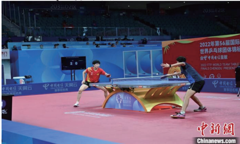
国乒男团成都世乒赛团体赛首秀。

中新网成都10月1日电 (记者 贺劭清 安源)中国国乒男团10月1日迎来2022