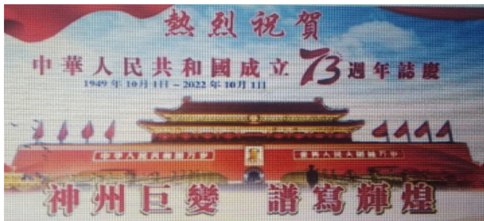
印尼华人社团祝贺中国第73届国庆。