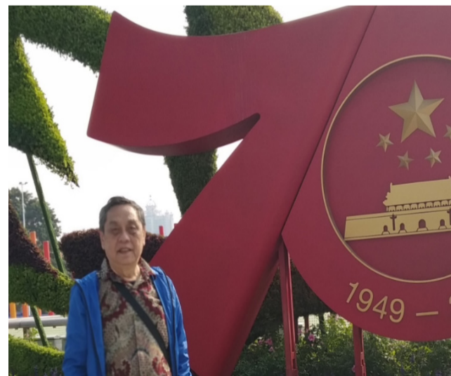
2019年，笔者在中国广州市拍照留念。