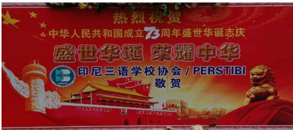
印尼三语学校协会 (PERSTIBI) 的贺词。