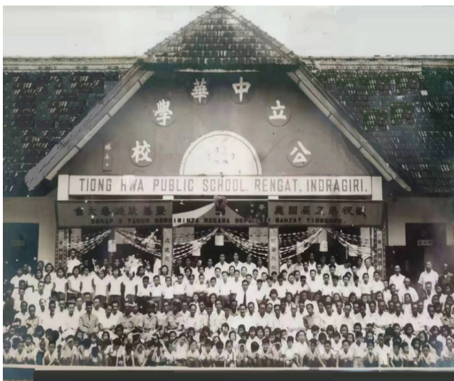
1954年10月1日，宁岳县中华学校举办“国庆”纪念活动。