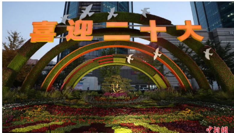
9月26日，主题花坛亮相北京长安街。