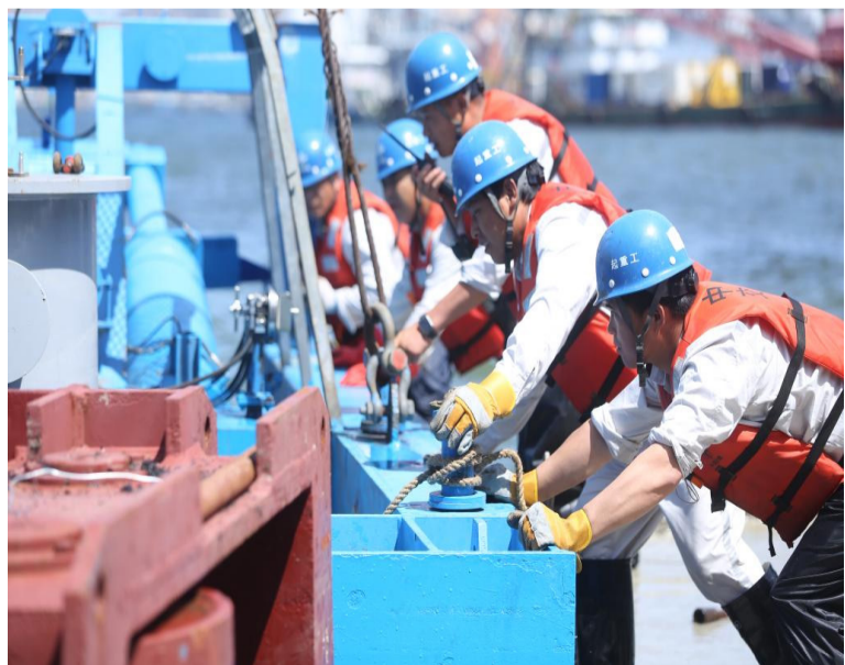
大连湾海底隧道施工资料图。