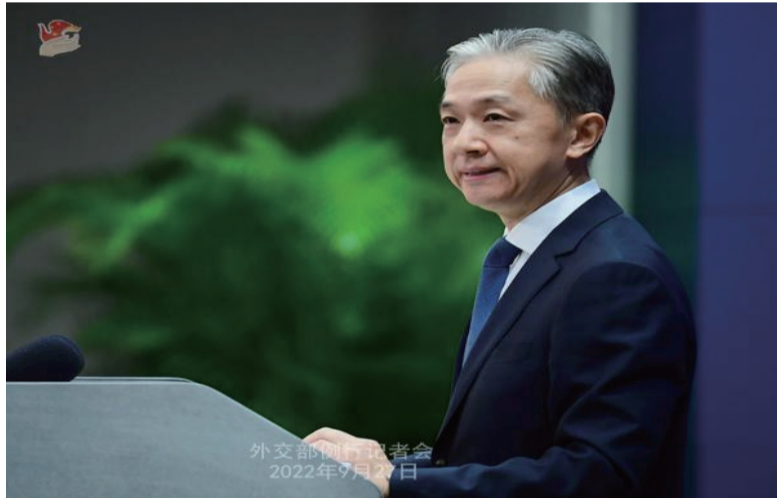
外交部发言人汪文斌。

的两大力量、促进共同发展的两大市场、推动人类进步的两大文明，坚持互利共赢、坚持多边主义、坚持求同存异，推动中欧关系健康稳定发展、世界经济持续复苏，为动荡变革的世界注入更多稳定性和正能量。(完)