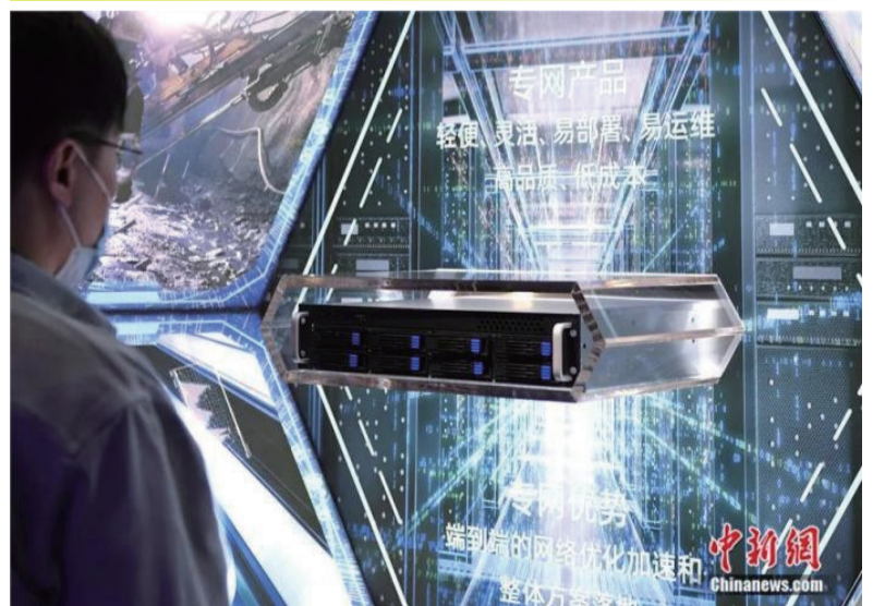
满足工业、能源、交通、医疗等通信服务需求的云原生核心网吸引参观者。