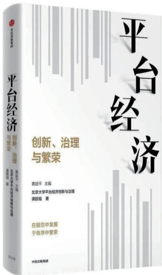
《平台经济——创新、治理与繁荣》