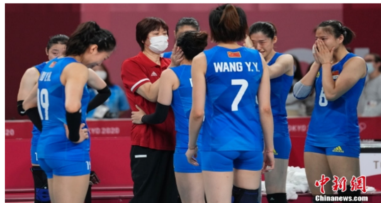
资料图：中国女排在东京奥运会中。