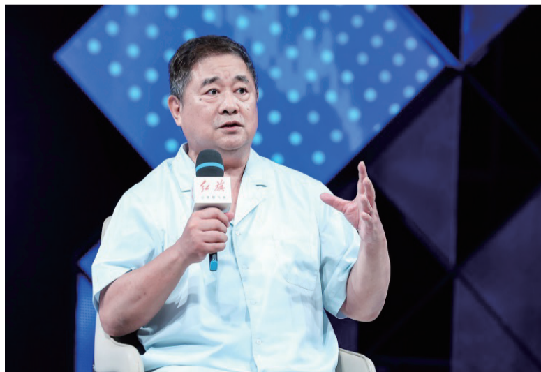
(中国文物学会会长、故宫博物院原院长单霁翔)