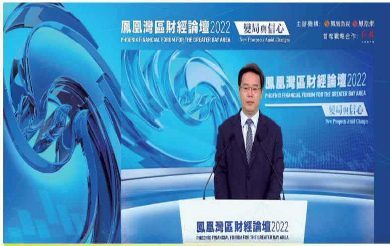
(深圳市市长覃伟中)