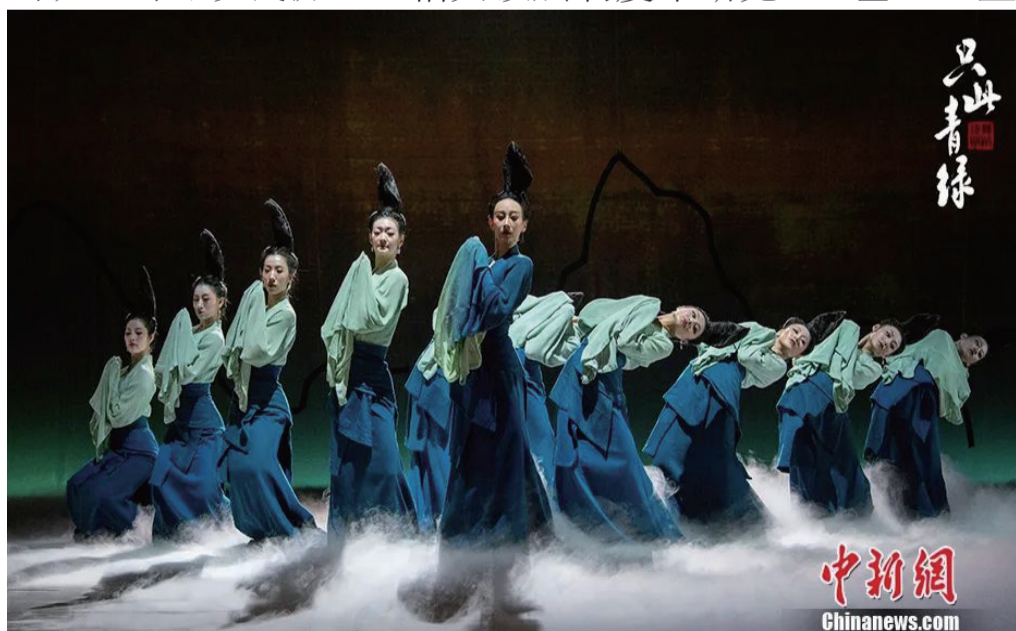
资料图：舞蹈诗剧《只此青绿》剧照。

“绿色发展机制具有自我实现性质。”中国社科院生态文明研究所所长张永生如此解读这种新风尚：当越来越多人相信绿色发展可行并