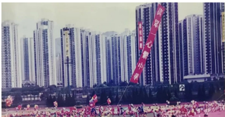
香港各界举行国庆庆祝活动