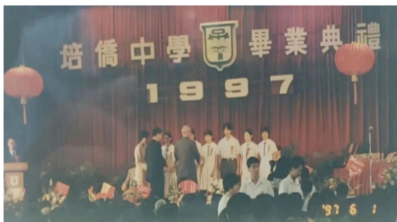
1997年6月1日香港培侨中学毕业典礼