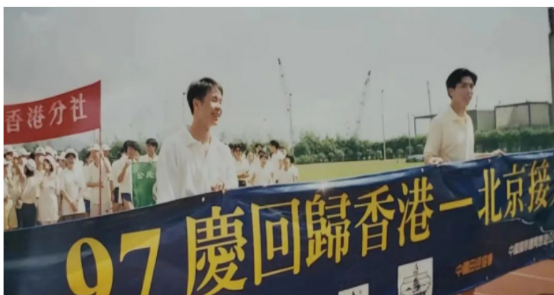
97庆回归香港—北京接力赛