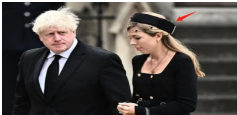
英国前首相约翰逊的夫人卡丽·约翰逊在出席英女王葬礼时也佩戴了网纱帽。