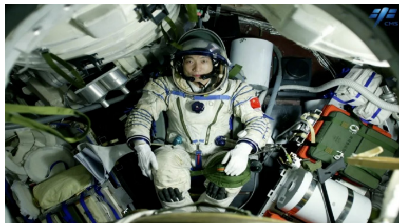
中国首飞航天员杨利伟/已进入太空的14名航天员（从左到右：杨利伟 费俊龙 聂海胜 翟志刚 刘伯明 景海鹏 刘旺 刘洋 张晓光 王亚平 陈冬 汤洪波 叶光富 蔡旭哲）