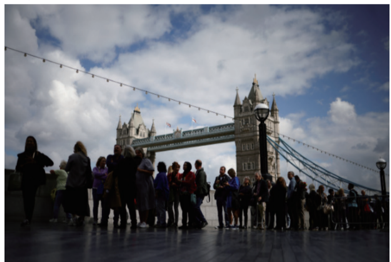
大批民众在伦敦塔桥附近排队，等待前往威斯敏斯特厅向英女王作最后道别。