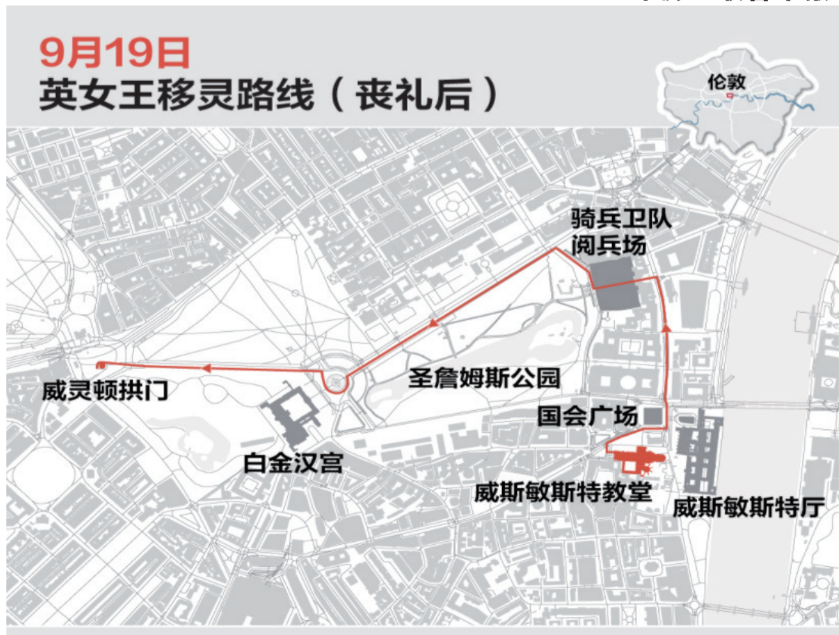
9月19日 英女王移灵路线 (丧礼后)