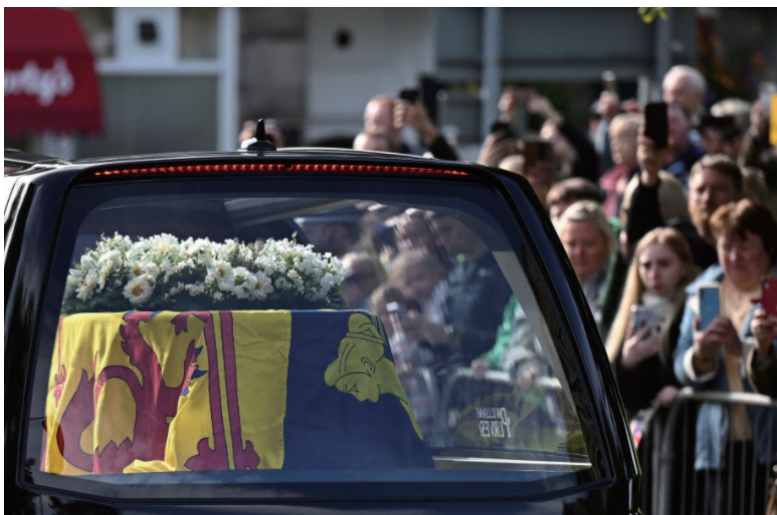
灵柩车队行经巴尔莫勒尔城堡附近村落巴勒特(Ballater)时,街道两旁站满致敬的民众。