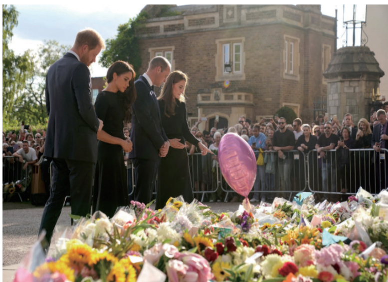
哈里王子(左起)与妻子梅根,以及威廉王子与妻子凯特王妃,在温莎城堡外看着民众献给英女王的花束和卡片。

丁堡,停放在英国王室在爱丁堡的官邸荷里路德宫(Palace of Holyroodhouse),大批民众夹道挥泪送别。