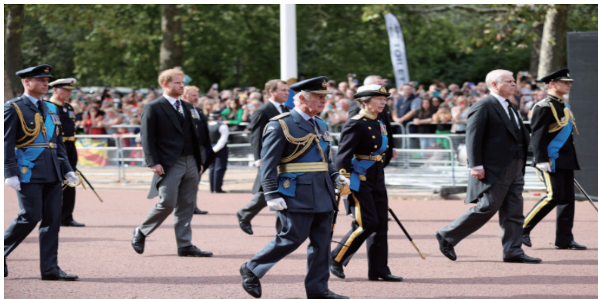
女王灵柩从白金汉宫移往威斯敏斯特厅,国王查尔斯三世(中)带领王室成员徒步护送近40分钟。