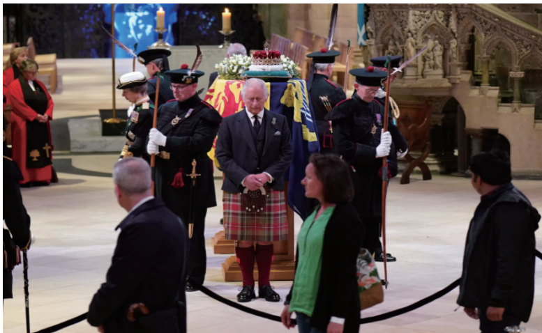
女王的子女为女王进行“王子守夜”,查尔斯三世站在灵柩前方位置。