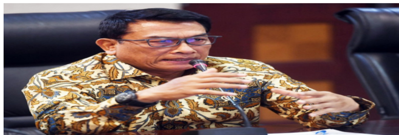
总统办公厅主任 (KSP) Moeldoko 将军