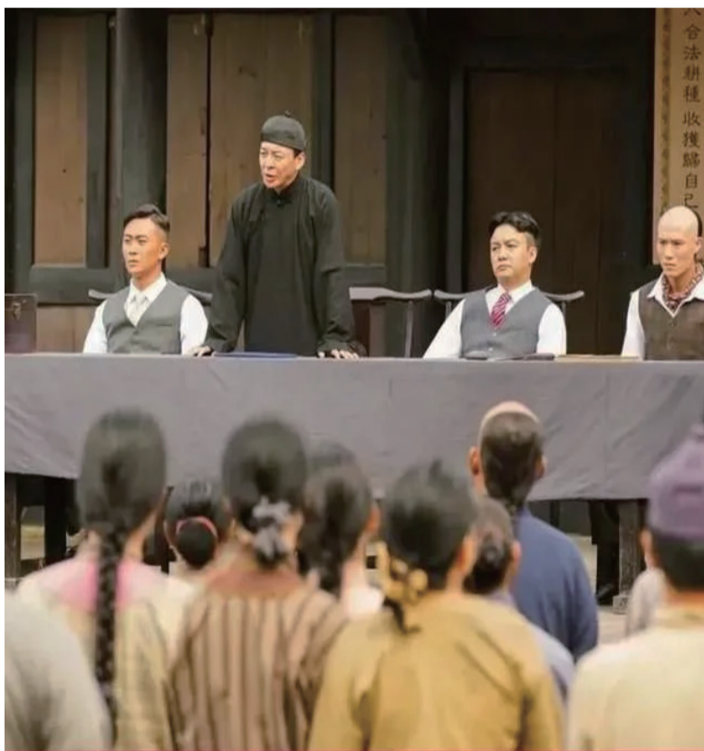
在中国第一个海外租借地， 他开辟了一座“新福州”。