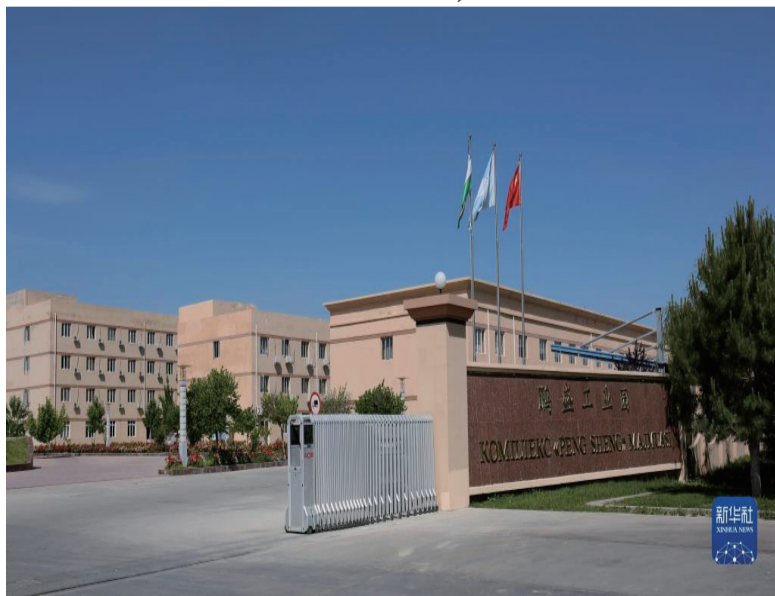
这是2018年5月8日拍摄的乌兹别克斯坦鹏盛工业园入口。鹏盛工业园是中国民营企业直接在乌投资建立的首个中乌合资工业园区。

青山着意化为桥。经过20多年努力，上合组织实现了从安全与经济合作的“双轮驱动”到“四个共同体”多轨并进，正向着更光明的前景锐意进发。撒马尔罕峰会再启程，上合组织将继续高举“上海精神”旗帜，致力于构建更加紧密的上海合作组织命运共同体，为世界持久和平与共同发展作出更大贡献。(记者韩墨、韩梁、陈杉、朱瑞卿)