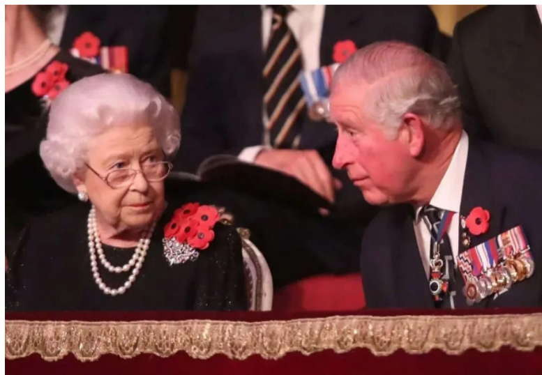
资料图：英国女王伊丽莎白二世和查尔斯王子。