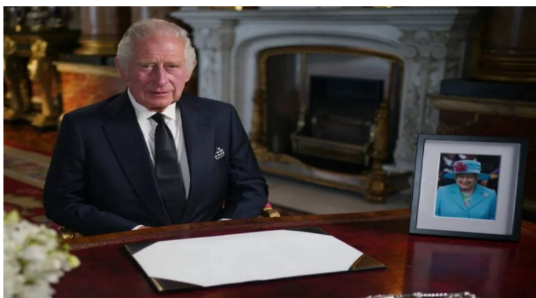
当地时间2022年9月9日，英国伦敦，英国国王查尔斯三世发表全国电视讲话，这是其首次作为国王发表电视讲话。

英国女王伊丽莎白二世在其21岁生日当天曾说，“我在众人面前发誓，无论寿命长短，我终身都会为你们服务。”