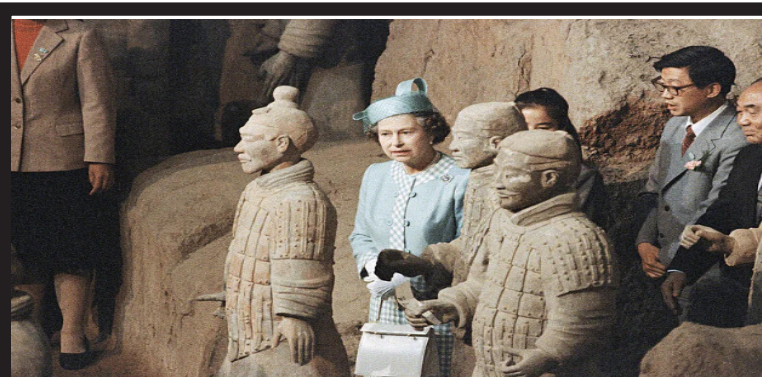
女王1986年10月访华期间参观兵马俑。