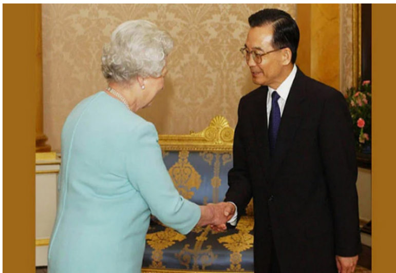
2004年5月11日，英国女王伊丽莎白二世在白金汉宫会见了正在伦敦进行正式访问的中国前总理温家宝。