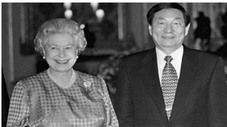
朱镕基1998年访问英国时和英国女王会面。