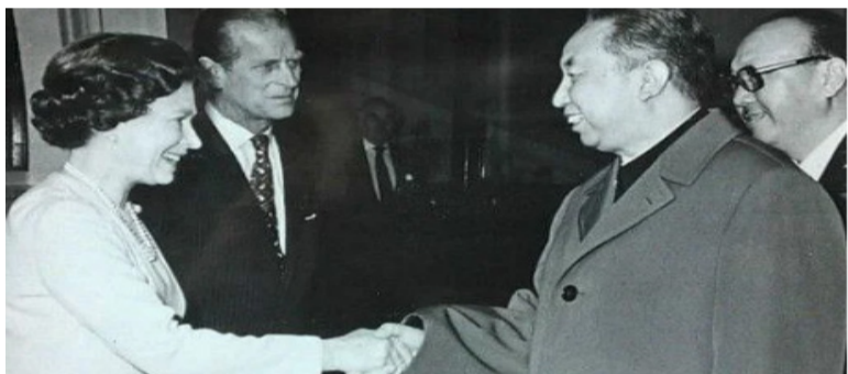
在华国锋1979年访问英国时，伊丽莎白二世在白金汉宫举行了盛大的欢迎仪式和招待会。（华国锋纪念网）