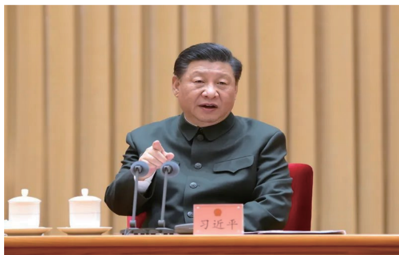
2021年3月9日下午，习近平出席十三届全国人大四次会议解放军和武警部队代表团全体会议并发表重要讲话。