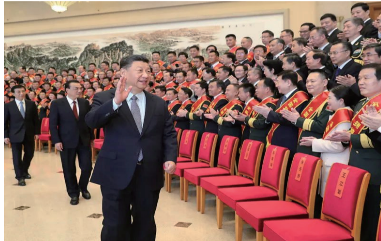
2020年10月20日，党和国家领导人习近平、李克强、王沪宁等在北京会见全国双拥模范城(县)命名暨双拥模范单位和个人表彰大会代表。