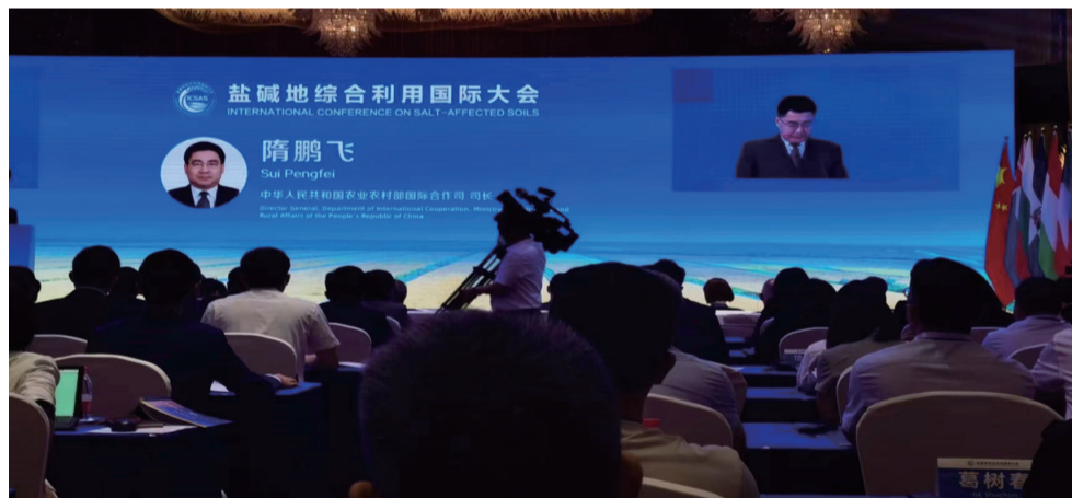
中国农业农村部国际合作司长隋鹏飞发言