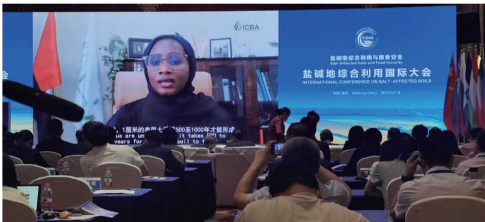
外国专家在盐碱地综合利用论坛活动上发言