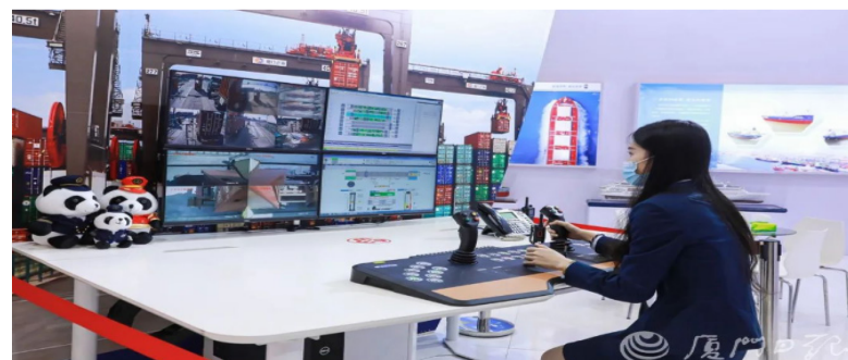
图为上届展会中展出的金砖国家工业领域合作的最新成果 (资料图)