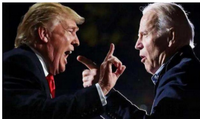
两个臭老头（左特朗普，右拜登）争吵不休