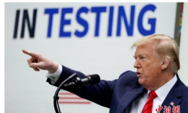
特朗普指着拜登尖鼻子大骂道：“你是国家的敌人！”