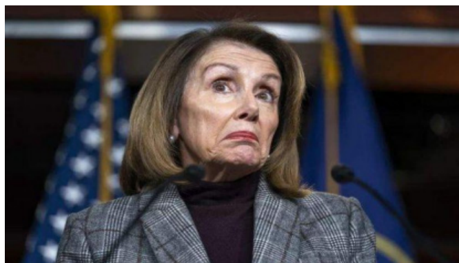
制造台海危机的美国众议院议长佩洛西老太婆