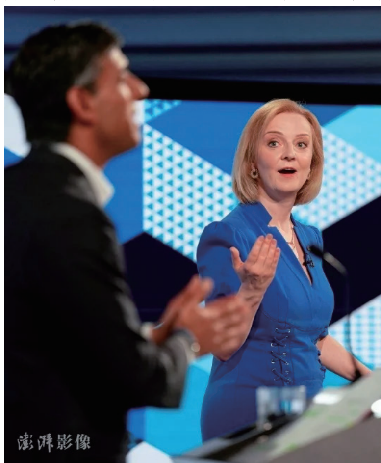
当地时间7月25日,竞逐英国首相的英国前财政大臣苏纳克和英国外交大臣特拉斯参加电视辩论。