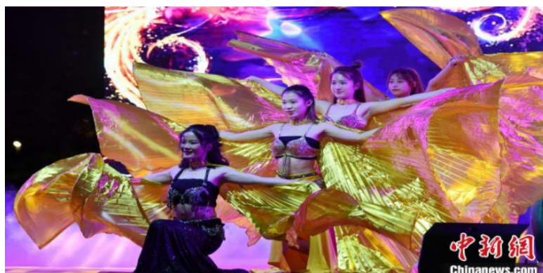
图为泰国特色舞蹈

福州市侨联方面表示,希望借助开展侨主题系列活动,欢迎广大归侨侨眷和海外侨胞常回家走一走、看一看、聊一聊,让乡情和友谊越来越浓、越来越深;广大归侨侨眷和海外侨胞发挥接轨国际、联系广泛、渠道畅通的优势,助力福州加快建设现代化国际城市。(完)