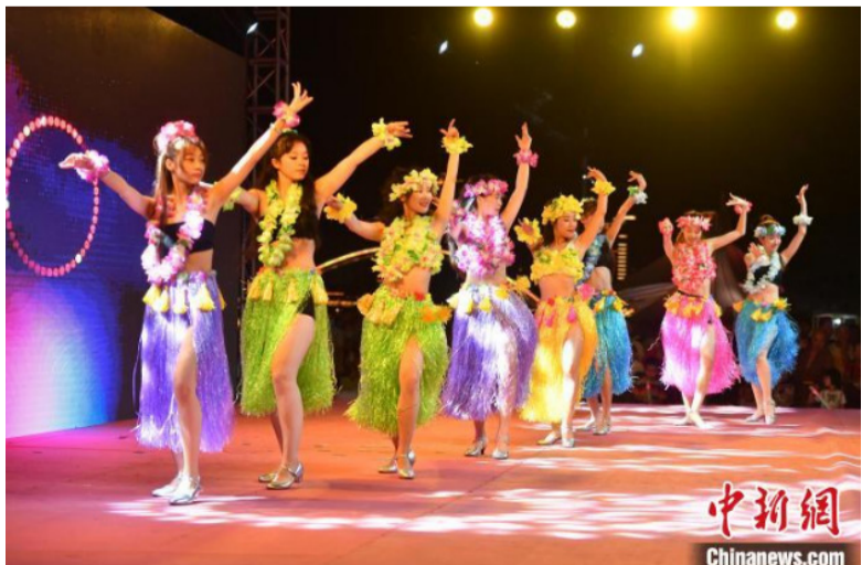
图为印尼草裙舞