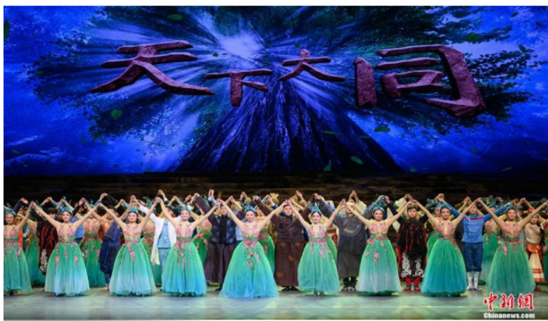
2021年3月，原创舞蹈诗剧《天下大同》在山西大剧院首演。

当今人类社会面临经济、政治、文化、生态等难题，如何应对日显严峻的现实危机，形成具有约束力和规范力的“全球机制”？