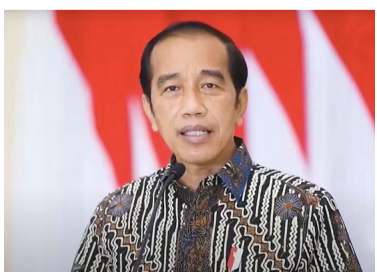
（本报讯）佐科维总统正式向全国宣布，

自9月3日下午二点半，全印民各地汽油提高价格，以减轻政府的严重负担。三种汽油调高价格如下：