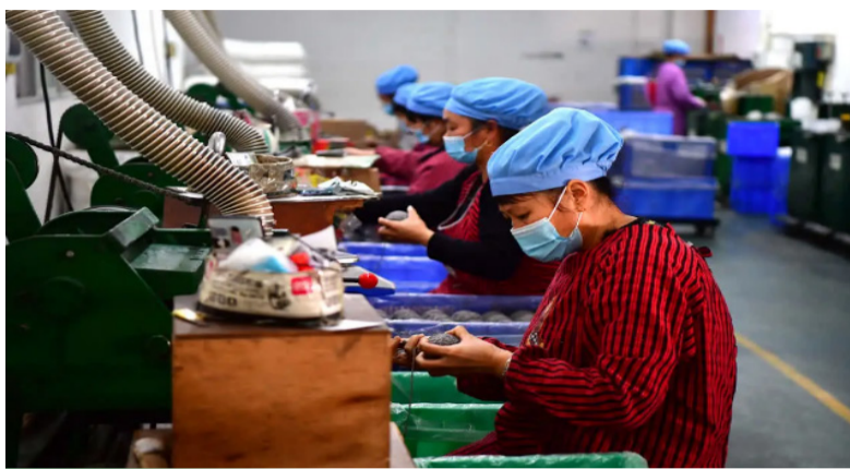
2021年2月21日，福建连城，春节假期过后，多家台资棒球用品生产企业里的工人们正忙于赶工生产棒球系列产品。

曹小衡：两岸经济合作的制度化及合作的深化，除了需要加强在高端制造业、生产性服务业、人才创新创业、更高层次的产业链等方面的力道外，还需要有一个新的、更高的平台，使两岸在合作的内容、模式、路径上能不断创新。随着中国大陆经济增长方式的转变，两岸经济合作深化的新平台将落脚于打造两岸共同市场。