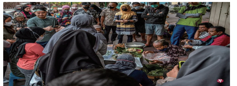
图为日惹一热闹集市，民众排队等着向一名90多岁的老摊贩买早餐。