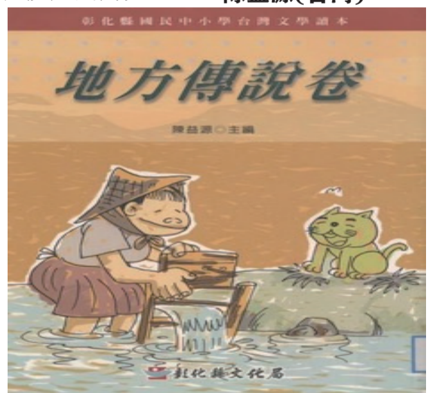
《彰化县国民中小学台湾文学读本·地方传说卷》书影