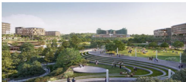
PUPR 部需要超过 26 万劳动力来建造群岛的国家新首都 (IKN), 直到 2024 年。

(本报讯) 公共工程和公共住房部 (PU-Pera) 需要超过 26 万工人来建造东加里曼丹群岛的国家新首都 (IKN), 直到 2024 年。