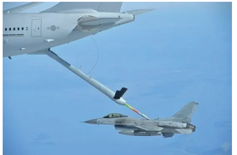
KC-330为KF-16进行空中加油