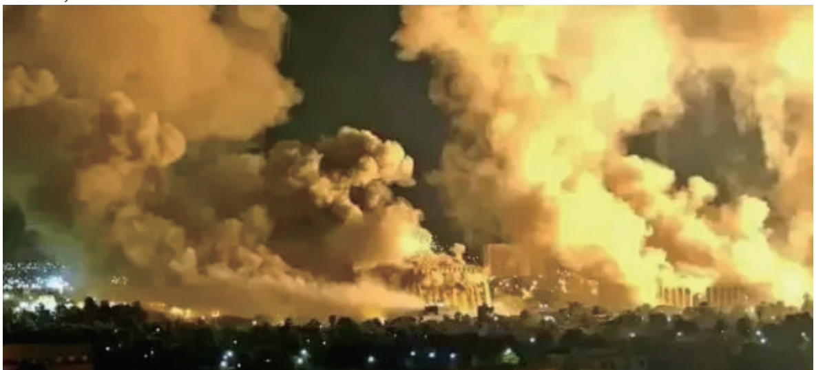
北约曾向南联盟 投下超过2000个集束炸弹