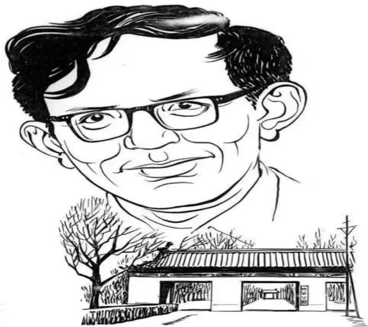
80年代的李泽厚（丁聪画）

要论证？什么叫哲学“论证”？这都是问题。休谟最有影响的不是《人性论》。这本大书出版后没多少反响，可能与他讲得太繁细有关。他后来写的《人类理解研究》，很薄的小册子，就很有影响。那本书相当好看，而且的确最重要，他要讲的主要内容都在里面了。他讲道德、政治的也很薄，都是“短论”。《纯粹理性批判》很厚，可是厚得有道理，这是康德最重要的书，其中包含了后来发挥开来的许多思想。他的《判断力批判》很薄。有关历史、政治的几篇论文，都不太长，但分量多重呀！黑格尔完全是从那里出来的。笛卡尔的《哲学原理》等几本书，都很薄，只有几万字，非常清晰，一目了然。霍布斯一本《利维坦》，柏克莱三本小册子，卢梭也是几本小薄书，就够了。杜威写了那么多书，我看中的也就是《确定性的寻求》，如再加一本，就是《艺术即经验》，其他的我都看不上。