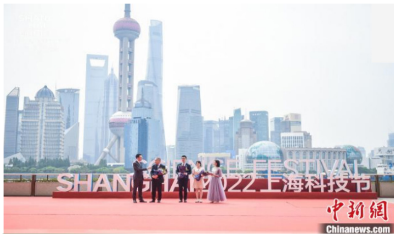
2022上海科技节科学红毯