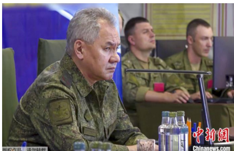
资料图：俄罗斯国防部长绍伊古。

中新网8月16日电 据塔斯社报道，当地时间16日，俄罗斯国防部长绍伊古在第十届莫斯科国际安全会议上表示，从军事角度来看，“俄罗斯不需要在乌克兰使用核武器以实现既定目标”。他表示，俄罗斯的核力量旨在威慑，因此在乌克兰使用它们没有军事意义。