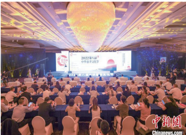
2022中华慈孝文化节在杭州启幕。