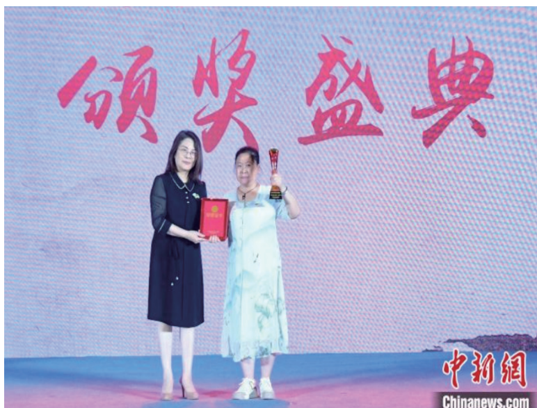
全国政协常委、浙江省政协副主席、民革浙江省委会主委吴晶(左)为“为百位烈士画像”项目颁奖。