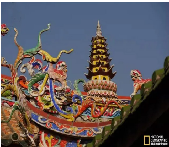
相比民居，庙堂建筑更是华丽无比。前三图为晋江灵源寺屋脊装饰，第四图为灵源寺大殿。

中国人很早就能够烧制红砖，但在民居建筑上运用不普及，原因有二：礼制不许民间用红色，只有宫廷、庙宇才可使用；青砖强度更大，质量更好。 （未完待续）