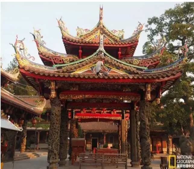
前三图为晋江灵源寺屋脊装饰，第四图为灵源寺大殿。