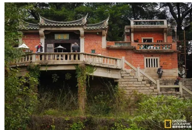
晋江草庵寺的形制，与红砖大厝无异，只规制更加高大。