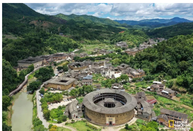
航拍福建永定洪坑土楼群。

闽南位于北回归线附近，是南亚热带地区。碧海边，龙眼树与荔枝林的绿荫，与一幢幢鲜艳的红砖大厝，互相映衬，总是让人眼前一亮。