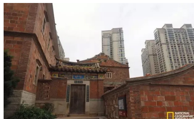
五店市红砖大厝，背景是后来崛起的高楼大厦。