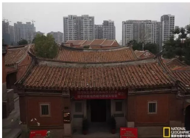
泉州市晋江五店市的红砖大厝和海月公宗祠。