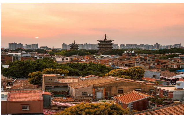
从空中看泉州，红色占据了城中的“C位”。建造于宋代的开元寺双塔，被红色的房子包围着。