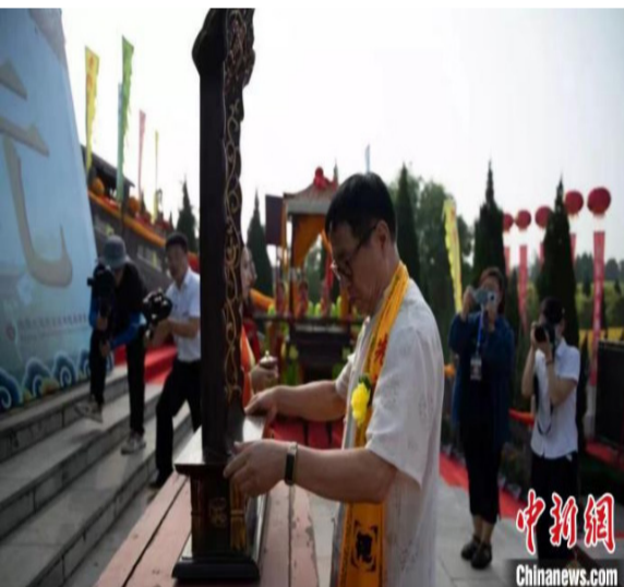
清明节、中元节、寒衣节是中国三大传统祭祖节日。