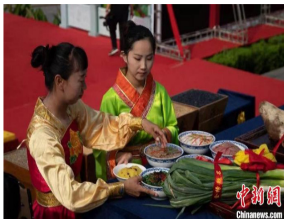
鉴于当前疫情防控形势,洪洞大槐树景区借助直播的方式,满足移民后裔和广大游客线上观祭需求。