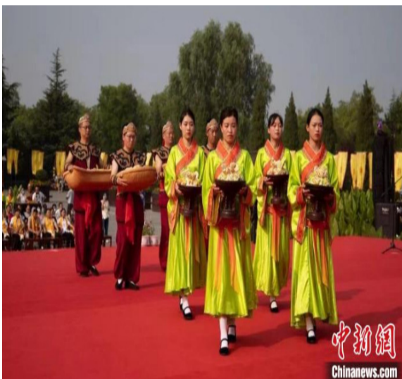
此次祭祖大典以“寻民族文化根 铸移民精神魂”为主题。