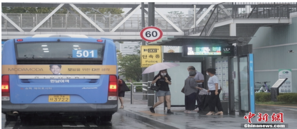
图为8月9日，雨中乘坐公交车的市民。