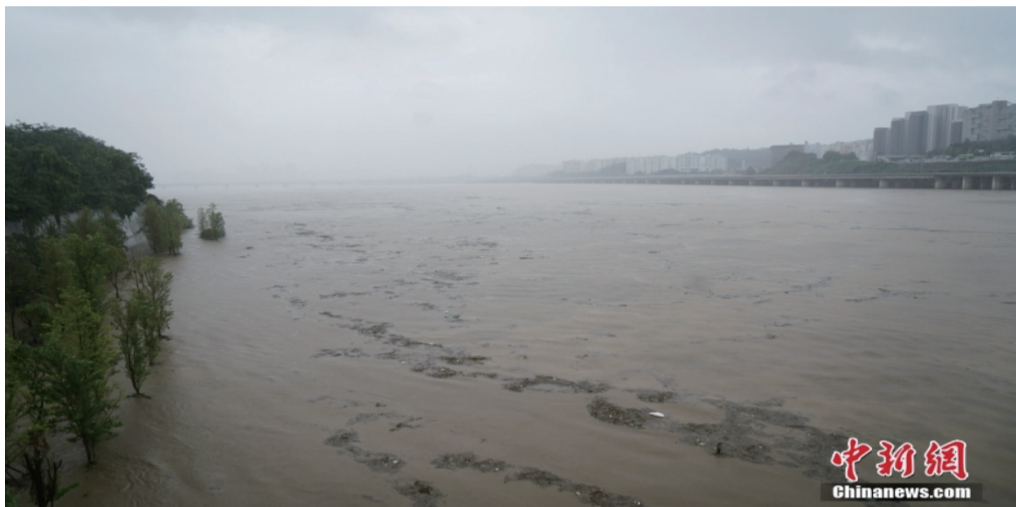
图为8月9日，暴雨后的汉江。 中新社记者 刘旭 摄

当地时间8月8日，韩国首都圈遭遇特大暴雨。据韩国中央灾难安全对策本部统计，截至当地时间9日上午10时，此次暴雨已经造成8人死亡、6人失踪、14人受伤。中国驻韩国大使馆工作人员向中新社记者证实，一名中国公民在暴雨引起的一起泥石流灾害中不幸身亡。 来源：中国新闻网