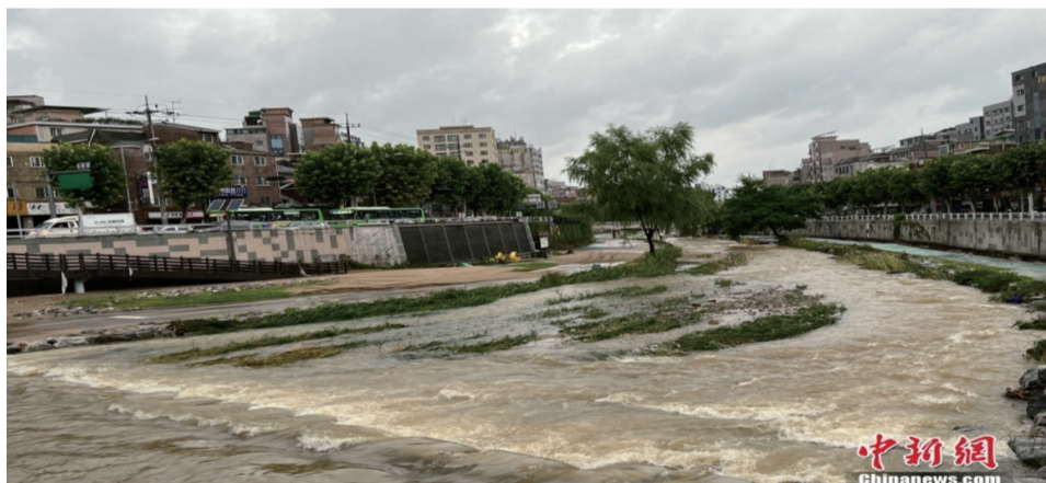
图为8月9日，首尔市冠岳区道林川溪流水位上涨。