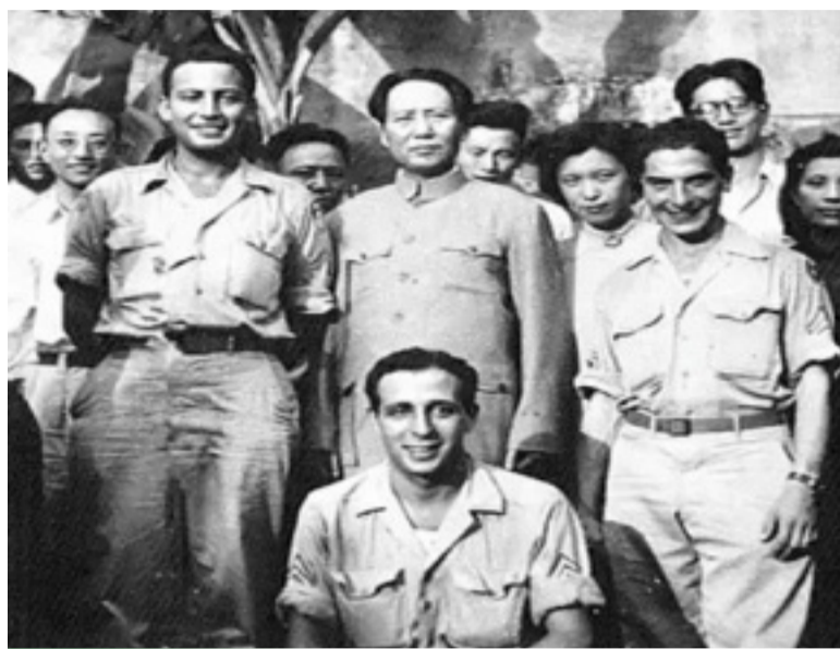
1945年9月16日，毛泽东在重庆红岩村和美国飞虎队员合影