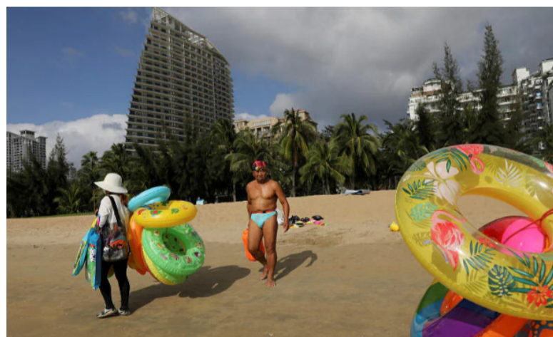
商贩在中国海南岛三亚市的沙滩上贩售游泳圈等物品。