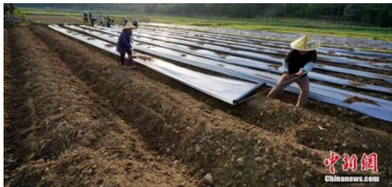
资料图：农民在田间铺地膜。