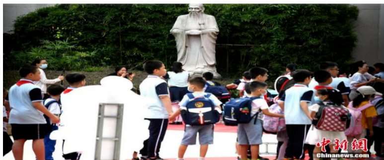
资料图：某小学，学生经过校园里的孔子雕塑并鞠躬。