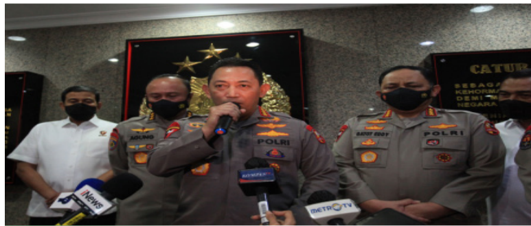
国家警察总长李迪约 (Listyo Sigit Prabowo) 将军 (中), 旁边是他的副警长卡鐸 (Gatot Eddy Pramono) 将军 (右) 和总监督检查局长 Comr. Agung Budi Maryoto 将军 (左) 于 2022 年 7 月 12 日在雅加达国家警察总部向新闻界成员介绍情况。