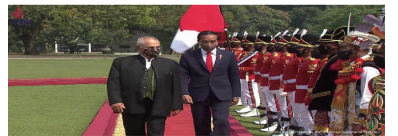
周二（2022年7月19日），佐科维总统和东帝汶民主共和国总统拉莫斯·霍达（Ramos-Horta）在西爪哇茂物总统府接受国家欢迎仪式。

后加拿大于7月9日宣布归还德国西门子送修的“北溪-1”天然气管道部件。7月17日，加拿大已将俄罗斯“北溪-1”天然气管道涡轮机空运至德国，预计于24日抵达俄罗斯。